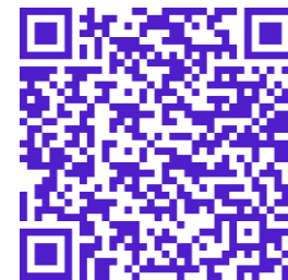
Поделки из природного материала